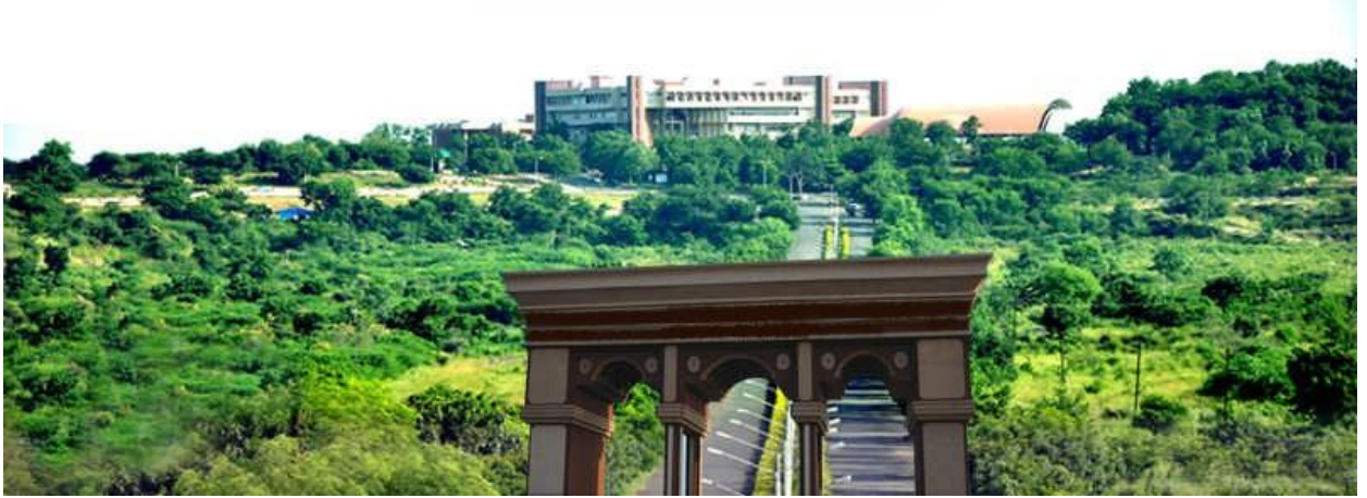
Kavayitri Bahinabai Chaudhari North Maharashtra University, Jalgaon

जनसवाद आणि पत्रकारिता विभाग, सामाजिकशास्त्रे प्रशाळा इमारत, फेज-1 कबचौडमवि, जळगाव