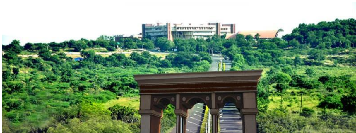
Kavayitri Bahinabai Chaudhari North Maharashtra University, Jalgaon